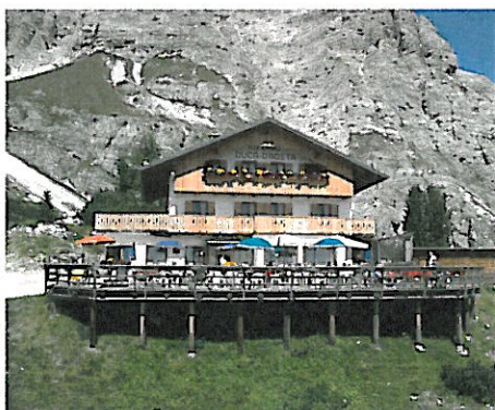
DUCA D'AOSTA mt. 2.098

CONVENZIONE: ANDATA E RITORNO PIU' PRANZO IN UNO DEI SEGUENTI RIFUGI SPECIAL DEAL INCLUDING RETURN TICKET AND LUNCH IN ONE OF THE FOLLOWING REFUGE ANGEBOT: HIN UND RÜCKFAHRT EINSCHLIESSLICH MITTAGESSEN IN EINER DER FOLGENDEN BERGHÜTTEN