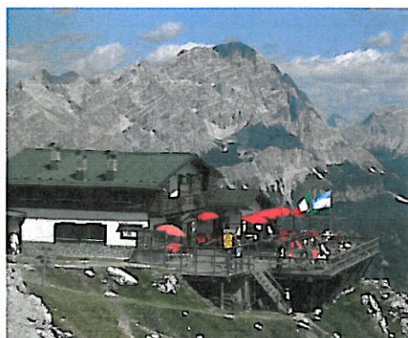
POMEDES mt. 2.303