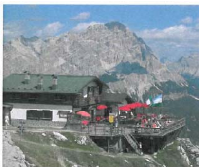
POMEDES mt. 2.303