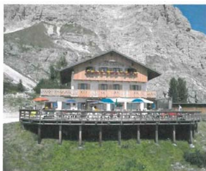
DUCA D'AOSTA mt. 2.098

RIDOTTI: fino a 12 anni – oltre i 65 anni – gruppo minimo 10 persone