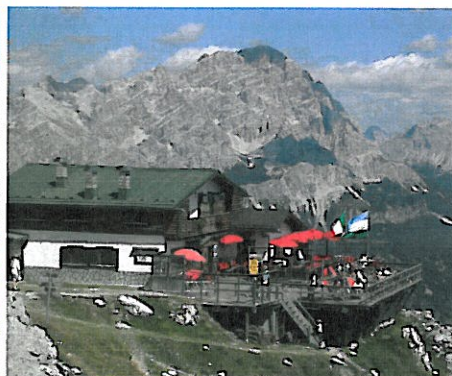
POMEDES mt. 2.303