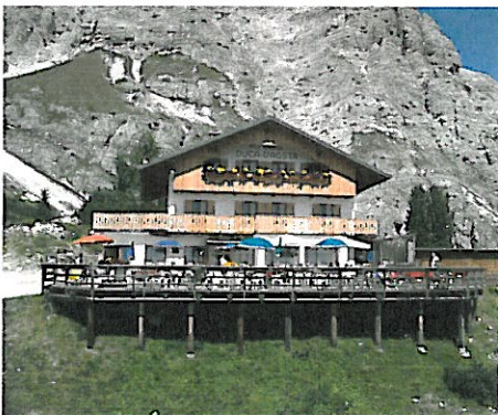
DUCA D'AOSTA mt. 2.098

CONVENZIONE: ANDATA E RITORNO PIU' PRANZO IN UNO DEI SEGUENTI RIFUGI SPECIAL DEAL INCLUDING RETURN TICKET AND LUNCH IN ONE OF THE FOLLOWING REFUGE ANGEBOT: HIN UND RÜCKFAHRT EINSCHLIESSLICH MITTAGESSEN IN EINER DER FOLGENDEN BERGHÜTTEN